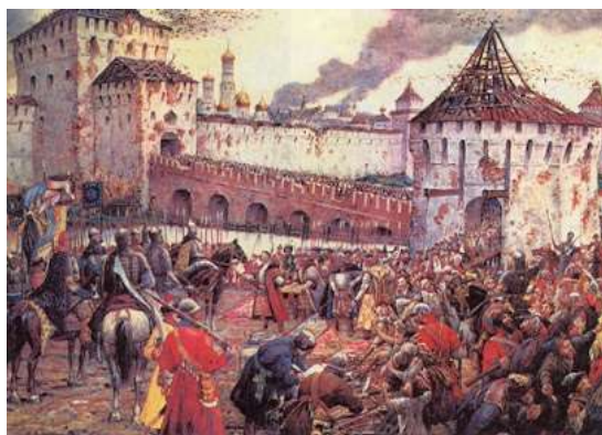
«Изгнание поляков из Кремля» Э. Лисснер