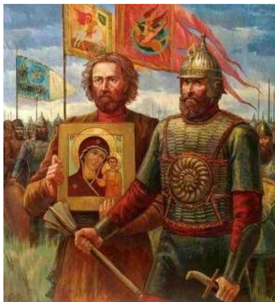
Картина «Минин и Пожарский»