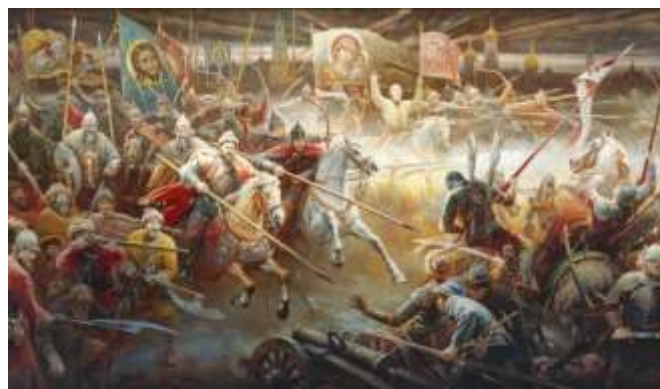
Гермоген Кречет Картина из серии «Минин и Пожарский»