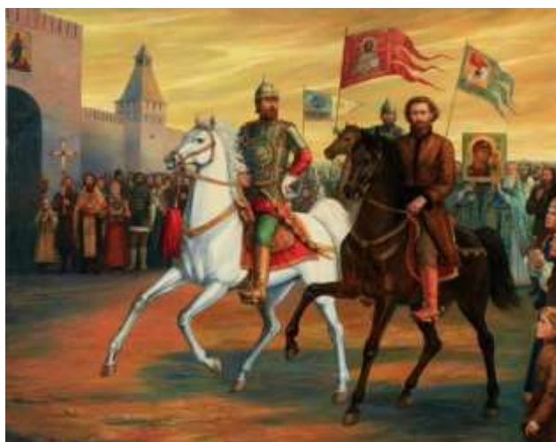
Валентина Ефимовская «Путь Спасения»