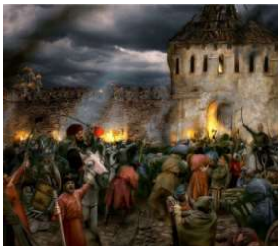
«Битва за Москву в 1612 г.»