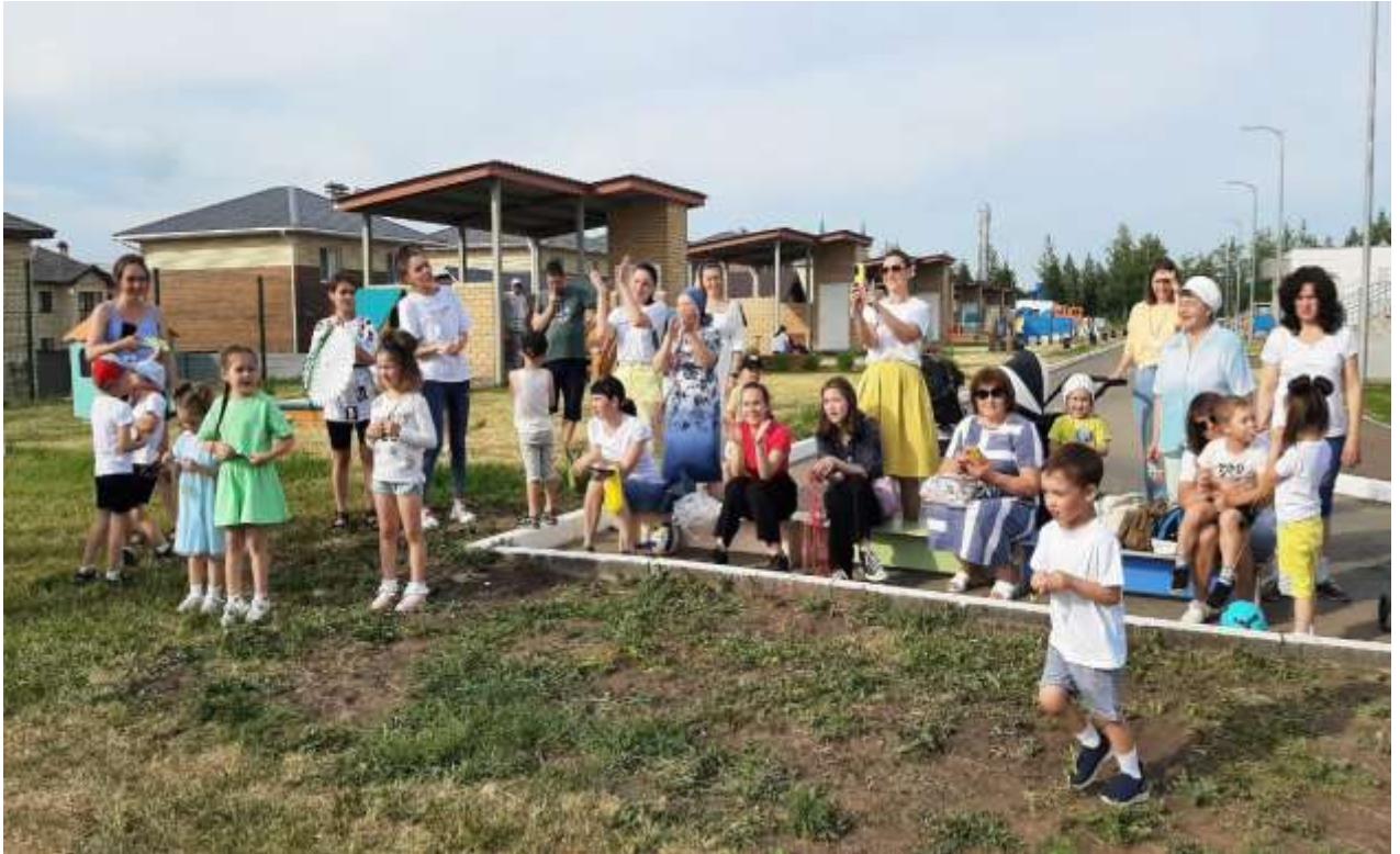
Мастер- класс по изготовлению «Воздушного змея»