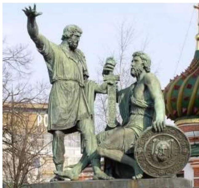
Созданный по проекту архитектора И. Матроса